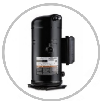
艾默生冷冻压缩机