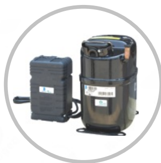
欧洲进口低温制冷压缩机