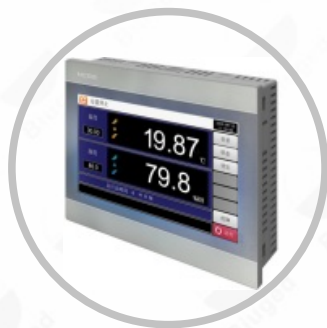
7寸真彩色触摸屏控制器

◆ 加热控制方式：温度控制器根据设定温度及试验箱内温度感传感器传输信号发送指令，通过逻辑电路调节控制SSR控制模块控制加热器输出量。工作可靠，无触点、无火花、寿命长、无噪声，无电磁干扰，开关速度快，抗干扰能力强，且体积小，耐振动、耐冲击，防爆、防潮、防腐蚀，以微小的控制信号达到直接驱动大电流负载的控制方式。