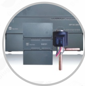
自主设计的控制系统